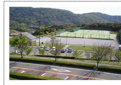
駐車場から人工芝庭球場