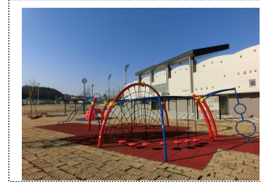
遊具広場、管理事務所