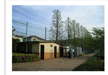
管理事務所・トイレ周辺