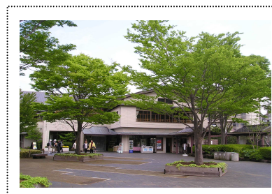
ビジターセンター周辺