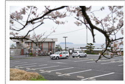
走水水源地公園駐車場