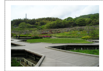
しょうぶ苑とふじ苑