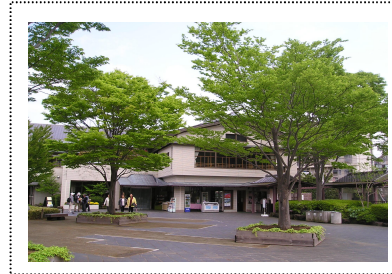
ビジターセンター周辺