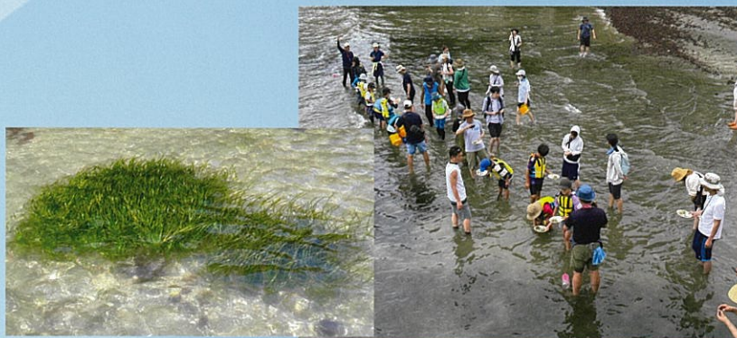
コアマモの植え付け体験の様子

横須賀港には、普段立ち入りはできませんが昔の東京湾を思い起こさせる一画があります。地域の親子やボランティアの手によって、コアマモの植え付けや生物の観察会が行われています。子どもたちの手によって、海の環境が次世代に引き継がれていきます。