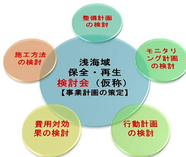
図9-2 検討会での検討事項