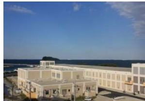
下町浄化センターへ統合