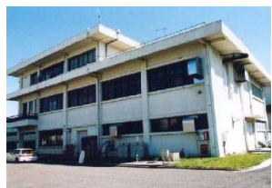
上町浄化センター廃止