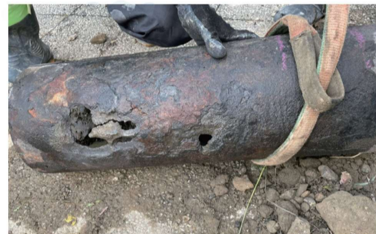
災害に強い管になるよう、工事を進めています。