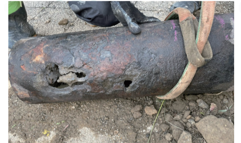
災害に強い管になるよう、工事を進めています。