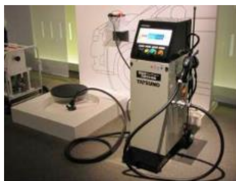
可搬式給油ポンプ