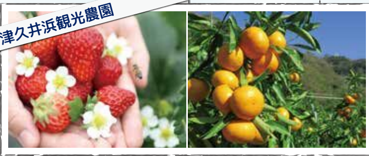
津久井浜観光農園