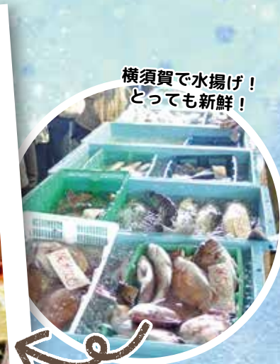
横須賀で水揚げ！ とっても新鮮！