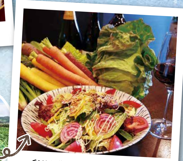
彩りも豊かな美味しい大地の恵