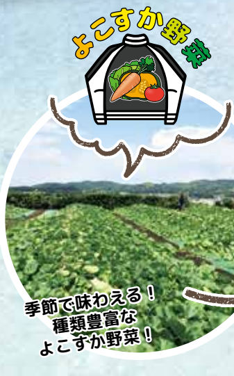
季節で味わえる！ 種類豊富なよこすか野菜！

季節ごとの新鮮な地元食材を、鮮度の良いおいしいときに味わえること、それは他にはない横須賀の魅力です。