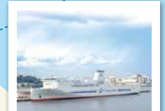
横須賀フェリーターミナル 横須賀港と新門司港(福岡県北九州市)を約21時間で結ぶフェリーが令和3年7月1日に就航しました。