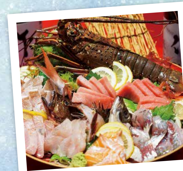
獲れたて新鮮な海の幸