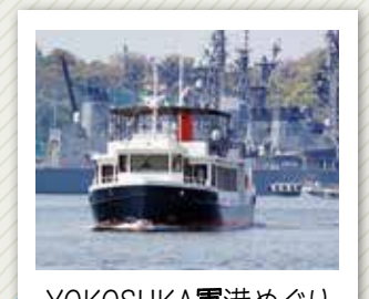
YOKOSUKA軍港めぐり 米海軍や海上自衛隊の艦船を、海上から間近に見ることができます。