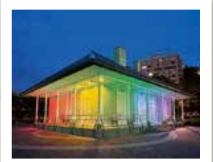
ティボディエ邸 日本近代化の礎となった横須賀製鉄所の歩みなどを展示しています。9時~17時。閉館後は、期間限定で様々なライトアップをすることもあります。