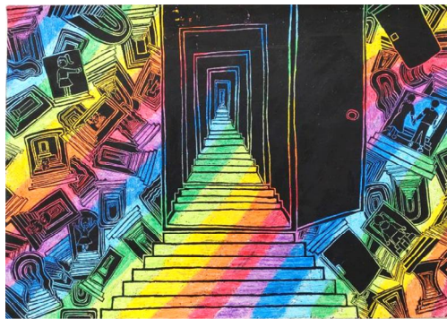
南部 柑菜（鶴久保小）