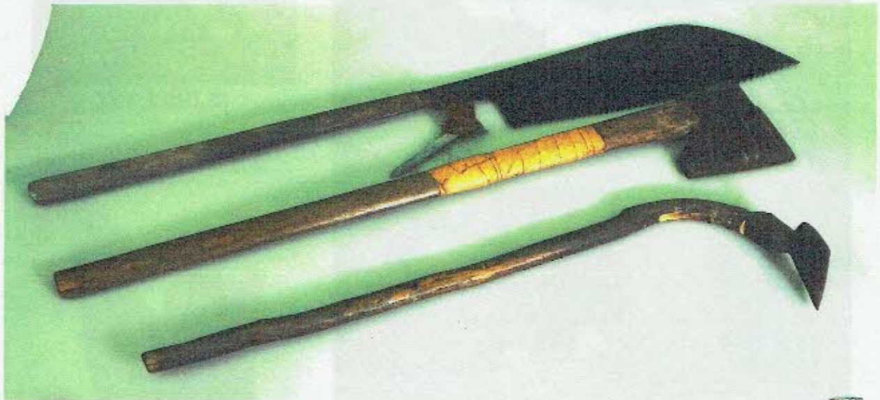
上から ノコギリ 手斧 平ガンナ