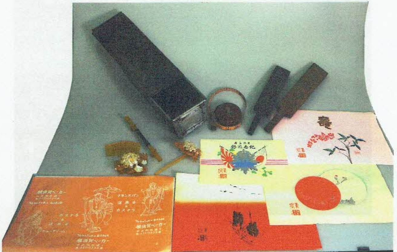
左奥から 食パン用焼型 大工用巻尺 和菓子用型抜 中段左 髪結び道具 手前左から パン屋包装紙 和菓子屋包装紙