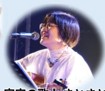
宇宙の歌人 さと さとみ