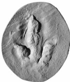
肉食恐竜の足跡グララター

ユタ州で2000年に発見された足跡化石産地。肉食恐竜の足跡化石がたくさん見つかり、約2億年前のようすが明らかになってきました。肉食恐竜がしゃがんだり、泳いだりしたことを示す化石は日本初公開！