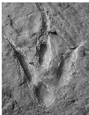
肉食恐竜の足跡アジアノボダス

ディロフォサウルス、ティラノサウルス、ディプロドクス、ステゴサウルス、トリケラトプスといった有名な恐竜の足跡化石を公開！