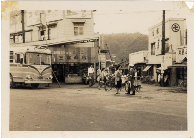
1964年の衣笠周辺写真