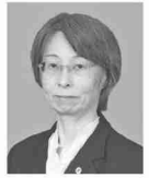
最高裁判所判事 岡村和美 昭和三年二月十三日生

事件が多角的な観点からアプローチし、その背景事情や経緯などを十分把握し、裁判で取り上げられている紛争や事件の裏面や相を十分把握し、それに適合する解決や判断をすることが、この年間の職務において努力してきました。現在、新型コロナウイルス感染症の影響により社会の在り方が根幹から変容を迫られる中、人々に予想されることが多岐にわたり、より柔軟な姿勢で事件に向き合つていく必要があります。また、裁判官は、書面審査が基本ですが、法廷で審理の期日が開かれる事件では、当事者(代理人)による活発な弁論がされるよう工夫をしています。また、法廷で審理の期日が開かれる事件では、当事者(代理人)による活発な弁論がされるよう工夫をしています。また、法廷で審理の期日が開かれる事件では、当事者(代理人)による活発な弁論がされるよう工夫をしています。