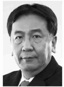
立憲民主党 代表 枝野幸男