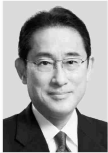
自民党総裁 岸田文雄