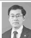
最高裁判所判事 宇賀克也 昭和三十三年七月二日生

最高裁判所において関与した主要な裁判 最高裁判所就任後日が浅いため、特に記すべきものはありません。 裁判官としての心構え 日本国憲法七六条三項の「すべて裁判官は、その良心に従って独立してその職務を行ふ」との憲法及び法律にのみ従ふべきことを常に念頭に置き、仕事を全うするに努めます。その中で、従うべき「良心」の充実・向上日々努め、「独立」は、自身の健全な心で自ら判断し、「職務」行使に当たっては、記録・資料を自ら読み、自分の頭でよく考え、わかりやすい自分の意見を言ひ、同僚裁判官と多面的に深く熟議を尽くすことを旨とし、一つの事件に全力で取り組みます。 また同憲法八一一条の「最高裁判所は、一切の法律、命令、規則又は処分が憲法に適合するかしないかを決定する権限を有する終審裁判所である」との趣旨を踏まえ、この憲法上の職務を適切に全うし、一七〇歳を以て、一つの事件に全力で取り組みます。