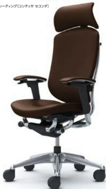
コンテッサセコンダ 総革張り仕様