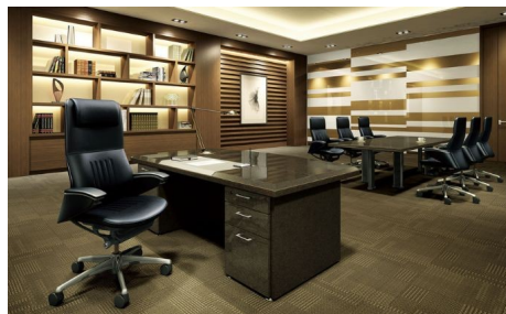
(オフィスでの使用イメージ)

横須賀市のふるさと納税における看板返礼品として定着したオカムラさんのオフィスチェア。多様なワークシーンに対応し、快適な座り心地を提供するオフィスチェアは、腰や背中に負担のかかるデスクワークを快適な時間へと変えてくれます。