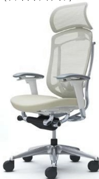
コンテッサセコンダ ホワイトボディタイプ