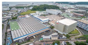
株式会社オカムラ 追浜事業所

オフィスをはじめ商業施設や物流センターなどさまざまなシーンにおいて、質の高い製品とサービスを提供しています。1958年から操業する追浜事業所では、オフィス製品の主力工場として座るもの（シーティング）を生産しています。