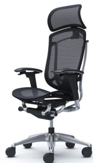
Contessa II seconda